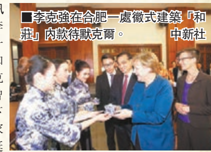
李克強在合肥一處徽式建築「和莊」內款待默克爾。

香港文匯報訊 據中新社報道，李克強昨晚在合肥一處徽式建築「和莊」內款待默克爾。去年默克爾曾對李克強表示，下次訪華希望到他家鄉看看，這也是延續她每次訪華造訪北京以外一座城市的「慣例」。對老友之請，李克強欣然應允。此次默克爾除了在徽式建築內欣賞徽字畫、品嚐徽菜外，還觀看了太平猴魁茶藝表演，默克爾回贈了德國皇家瓷器廠生產的陶瓷人像。