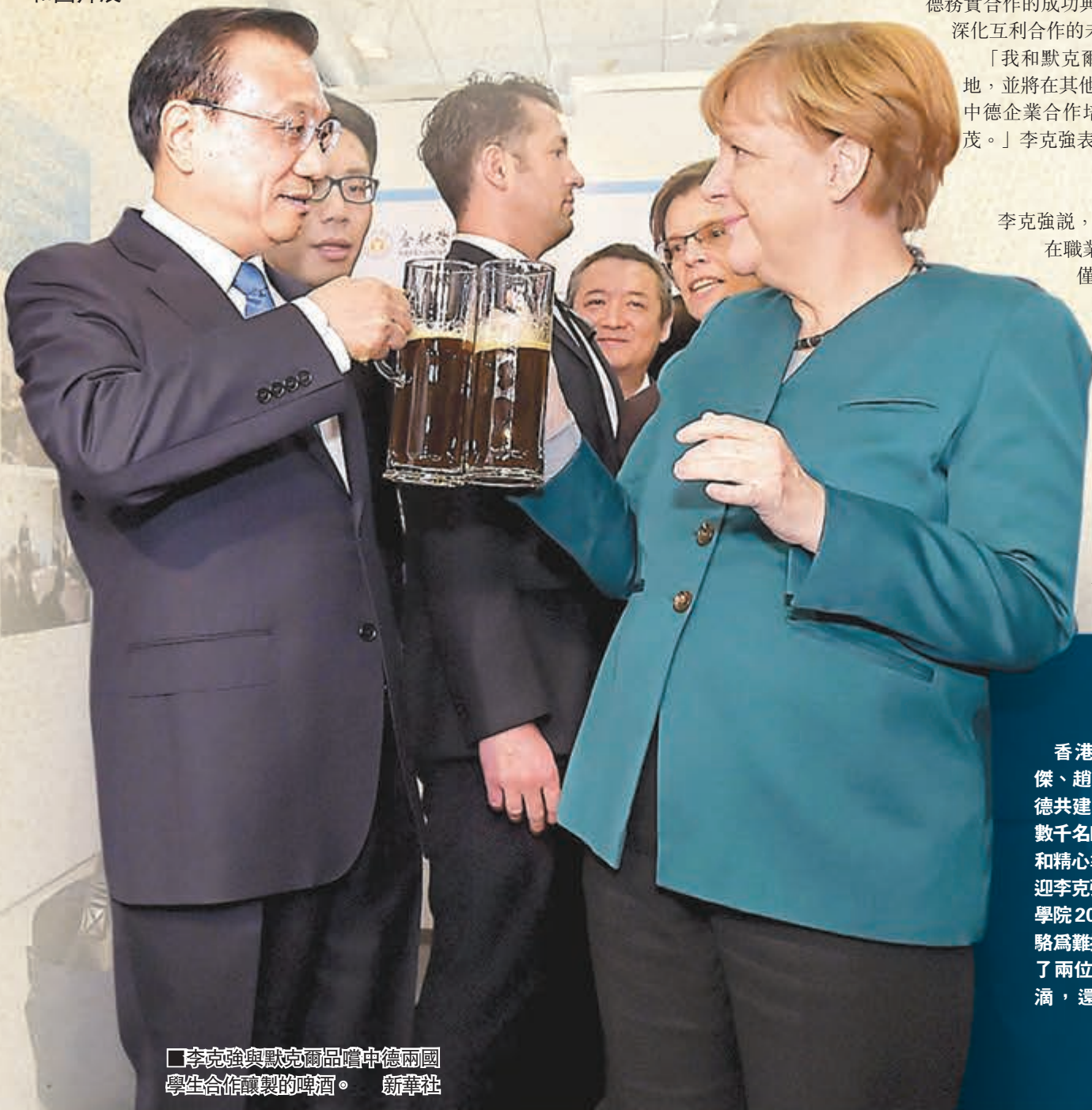
李克強與默克爾品嚐由中德兩國學生合作釀製的啤酒。

香港文匯報訊 據中新社報道，國務院總理李克強與德國總理默克爾昨日上午共同參觀了與德國頗有淵源的安徽合肥學院，宣佈在這裡設立中德教育合作示範基地。兩位總理的到來引起校園「轟動」，師生們揮舞着中德兩國國旗歡迎兩位總理，二人一道與學子們握手交流，隨後觀看了中德合作共建合肥學院30周年的視頻和圖片展。