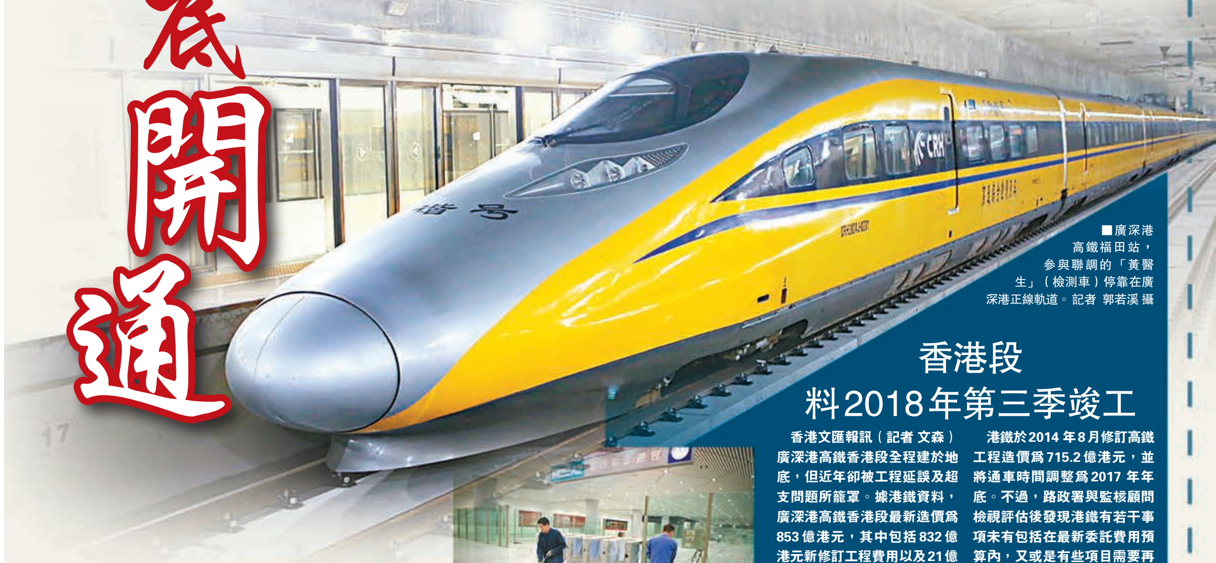
廣深港高鐵福田站,參與聯調的「黃醫生」(檢測車)停靠在廣深港正線軌道。

廣深港客運專線福田站建成通車後,標誌着香港即將融入內地的高鐵網,這對於進一步促進內地與港澳地區的經貿文化和人員往來具有重要現實意義。香港段開通後,從深圳和廣州坐高鐵,分別僅需15分鐘和30分鐘便可到達香港,形成「廣深港半小時經濟圈」。