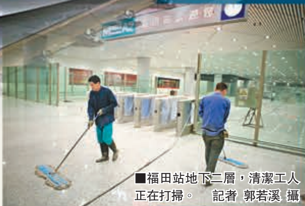
福田站地下二層,清潔工人正在打掃。