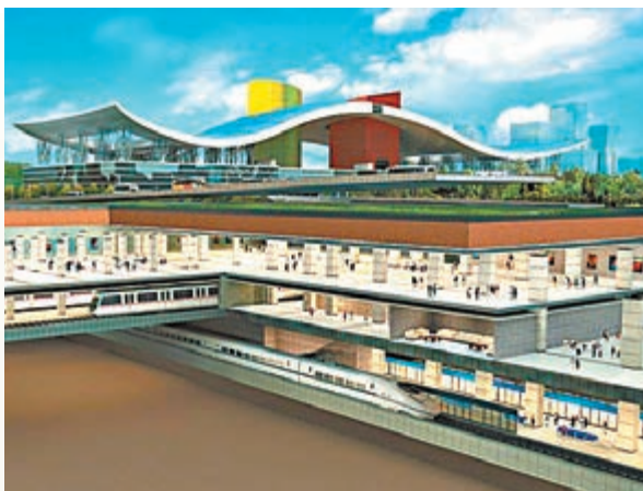
深圳福田站效果圖。