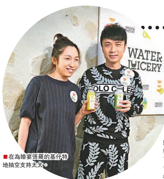
在為婚宴張羅的基仔特地抽空支持太太。

基仔指老婆又搞餅又搞果汁生意，可想而知她很喜欢飲食，「她揀老公揀我，便知她『識食』。」基仔說畢後都忍不住哈哈大笑。