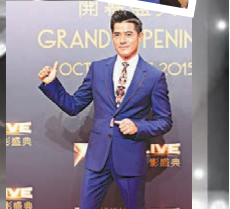
城讚同場的荷里活巨星們都是很好的演員。