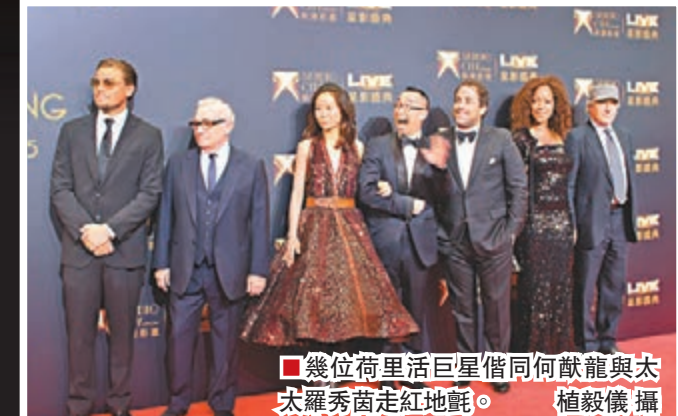
幾位荷里活巨星借同何猷龍與太羅秀茵走紅地毯。

寒喧過後，眾星為醒獅點睛，然後四男各手持《選角風雲》四個書法大字，各自加上一筆，於醒獅前合照。記者會約20分鐘完成。而晚上舉行新濠影滙開幕禮，除紅地毯外，表演嘉賓仲有三位巨星歌手，包括美國巨肺天后瑪麗嘉兒、韓國人氣女子組合SISTAR及郭富城，星光熠熠！