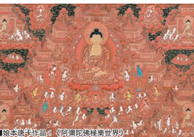
娘本唐卡作品：《阿彌陀佛極樂世界》

在30年的藝術生涯中，娘本吸取各家所長，逐步形成了色彩絢麗大方、畫面構圖精細複雜、畫面人物神態生動的獨特作品風格。其唐卡作品《護法金剛》、《四臂觀音》等被中國美術館、中國國家博物館等收藏。在唐卡的創作與傳承中，娘本看到了唐