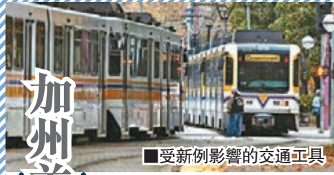
加州首府公共車輛禁睡覺

另一參與研究的教授埃爾塔希爾稱，雖然上述的超級熱浪不會經常發生，而阿布扎比、迪拜及多哈等城市居民只要利用冷氣，仍然能夠勉強居住，但對於室外工作者或沒冷氣的，將是無法忍受。埃爾塔希爾又提到沙特阿拉伯聖地亞加氣溫雖然相對沒那麼熱，但仍然是足以威脅數百萬朝聖者的性命。