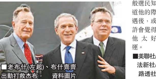
老布什(左起)、布什齊齊出動打救杰布。