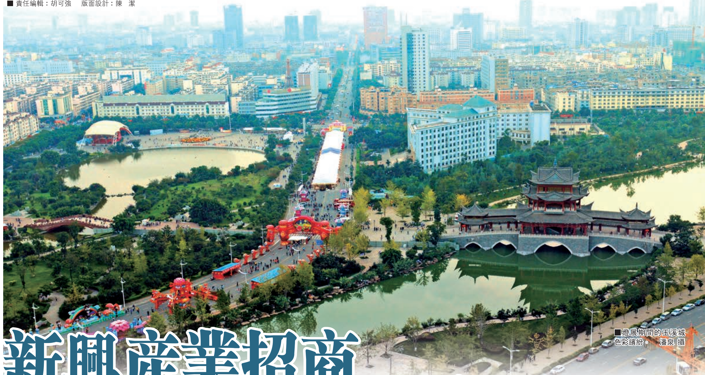
■ 燈展期間的玉溪城色彩繽紛。