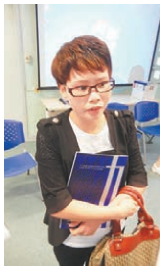
林太一度因學費問題而對協恩卻步，但在了解有學費減免後鬆一口氣，將鼓勵女兒報考。