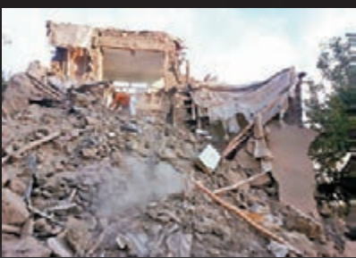
■阿富汗有房屋成廢垣敗瓦。