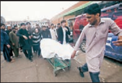
■巴基斯坦多人遇難。