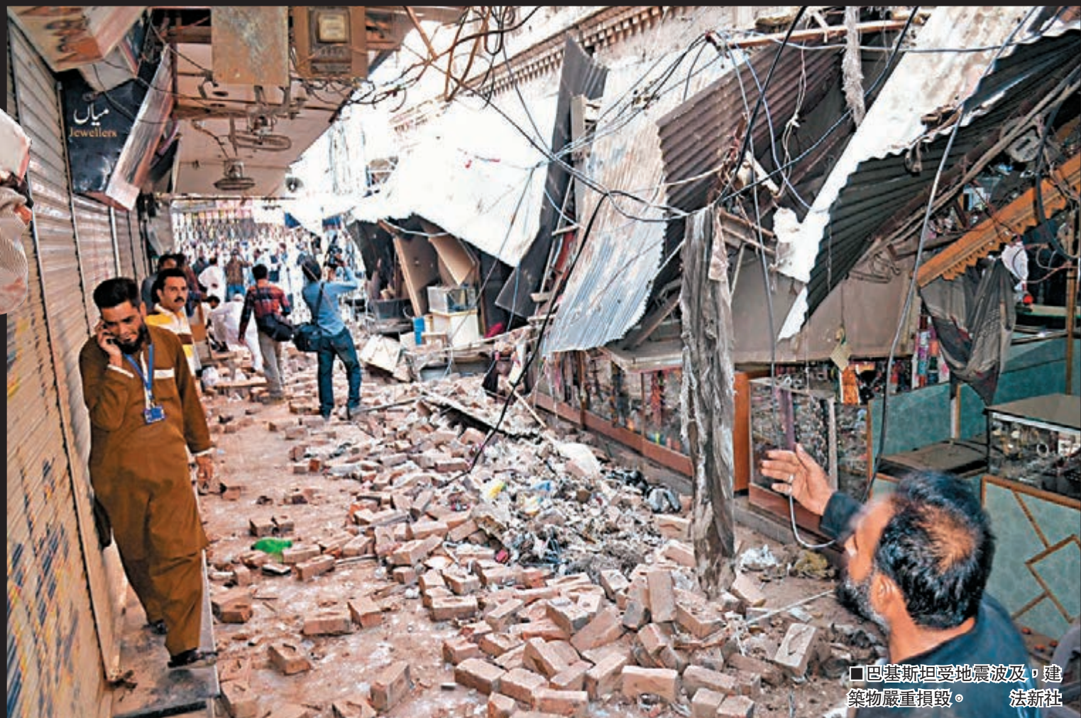
■巴基斯坦受地震波及，建築物嚴重損毀。