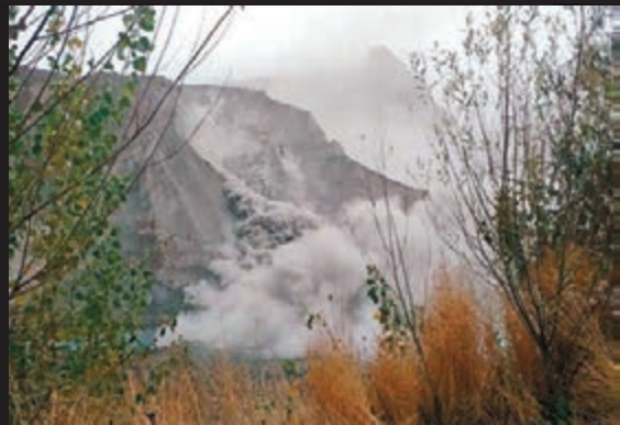
■地震引發山石滾落。

今次阿富汗強震震央位於中亞興都庫什山脈，與新疆南部地區接近，喀什、和田、阿克蘇和克孜勒蘇柯爾克孜自治州等多處地方均感到強烈震動。當地有居民稱震動分兩次襲來，合共持續約2分鐘，「晃得好厲害」，不少人即時跑到屋外空地。暫時未有傷亡和房屋倒塌報告。