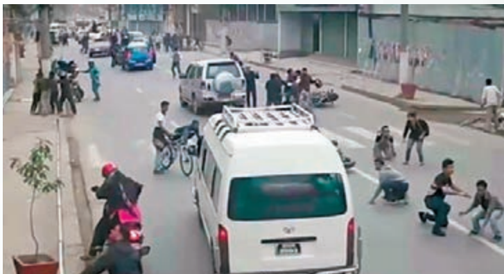
■地震一刻多人東歪西倒。