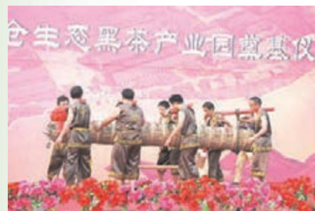
8名壯漢抬「萬兩茶王」。

10月23日，中糧百年木倉生態黑茶產業園在第三屆中國湖南(安化)黑茶文化節期間正式奠基。該集團斥資2億元人民幣將安化第一茶廠這一有着113年製茶歷史的文物級老廠，建成為集黑茶科研、黑茶加工、黑茶文化和黑茶旅遊於一體的中國黑茶中心。在奠基儀式的現場，安化第一茶廠還選出一根萬兩茶，該茶淨重362.5公斤，長3.8