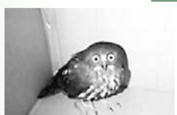
被謝女士放在紙盒裡的貓頭鷹。

放飛在一片樹林內。「牠很快就飛不見了，與白天相比狀態完全不同，相處了幾個小時，還真有點捨不得。」