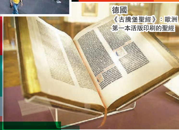
德國 《古騰堡聖經》：歐洲第一活版印刷的聖經