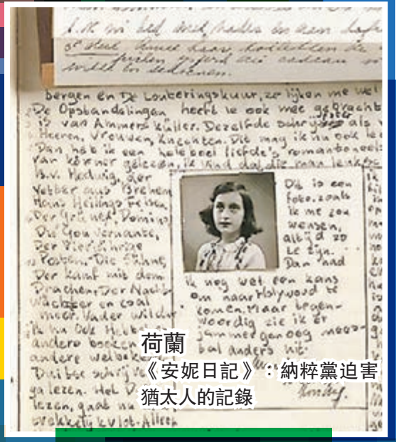
荷蘭 《安妮日記》：納粹黨迫害猶太人的記錄