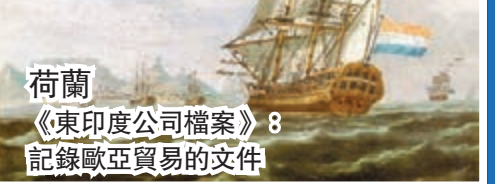
荷蘭 《東印度公司檔案》：記錄歐亞貿易的文件

文獻是否應避免涉及政治 1. 政治和戰爭是記憶的一部分 2. 僅中日提交的文件有爭議 3. 若記錄正確，名錄不應考慮是否涉及政治