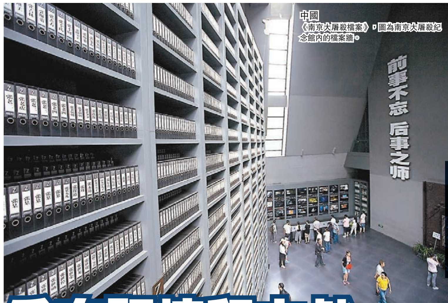
中國 《南京大屠殺檔案》：圖為南京大屠殺紀念館內的檔案牆。