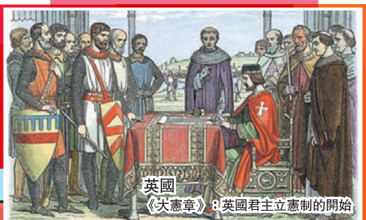
英國 《大憲章》：英國君主立憲制的開始