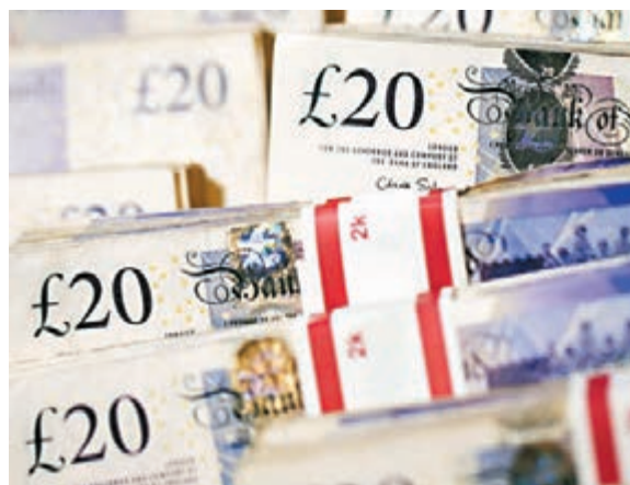
摩根士丹利分析師預料，在中國3.5萬億美元外匯儲備中，將把其中約10%的份額配置為英鎊。