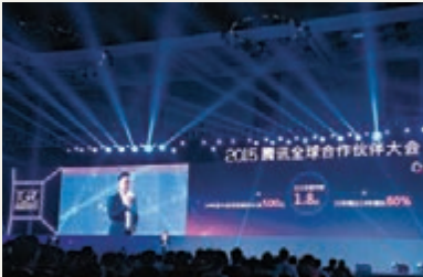
2015 騰訊全球合作夥伴大會現場。本報重慶傳真

香港文匯報訊(記者袁巧重慶報道)以「開放·無界」為主題的2015騰訊全球合作夥伴大會近日在重慶開幕，超過8,000名合作夥伴參加大會。騰訊(0700)QQ、騰訊應用等分別發佈了自己的新產品和戰略，並提出未來三年將為合作夥伴提供10億元(人民幣，下同)扶持計劃，同時投入100億元幫助1,000家傳統企業成功轉型互聯網化。