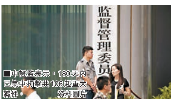
中證監表示，180天內已集中打擊共106起重大案件。

此外，中證監網站昨日公佈，對「證監法網」第七批專項行動中的12宗操縱證券市場案件調查、審理完畢。該12宗案件已進入告知程序，包括5種類型：第一類為3宗操縱ETF案件，第二類為2宗利用融券機制