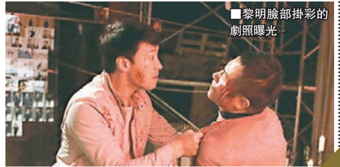
黎明面部掛彩的劇照曝光。

意外打斷。近年來香港四大天王中，黎明可以說是接拍電影最少的，如今對他來說，接戲最大的要求就是「好題材、好故事」。