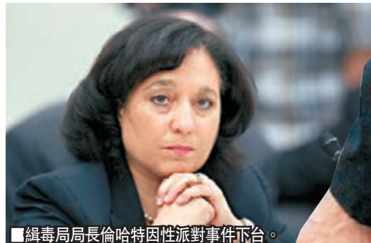
■緝毒局局長倫哈特因性派對事件下台。

美國緝毒局(DEA)繼早前被揭發10名特工駐守哥倫比亞期間，多次接受毒販的性派對款待後，局方再被踢爆半數涉案特工在受查期間，仍然獲發1,900至4,500美元(約1.5萬至3.5萬港元)的獎金或津貼，違反緝毒局指引。眾議院司法委員會主席古德萊特指責事件不可接受，要求緝毒局作出改善。