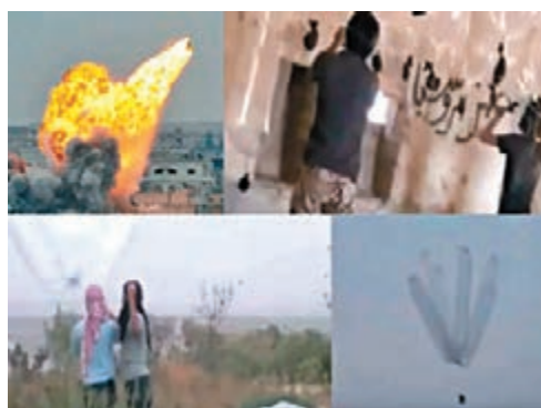
■「伊斯蘭國」發放安全套炸彈片段。

極端組織「伊拉克和黎凡特伊斯蘭國」(ISIL)周三上載片段，顯示敘利亞北部城市伊德利卜的武裝分子，將炸藥綁在充氣安全套上，放上半空後引爆，發出巨響。報章認為，片段反映ISIL已無計可施，不惜用盡一切方法向上月開始空襲敘利亞的俄軍戰機反擊。