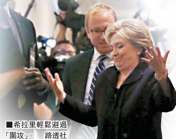
■希拉里輕鬆避過「圍攻」。