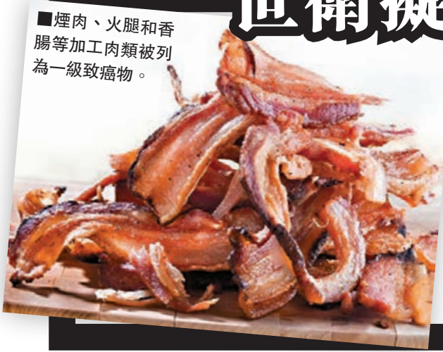
■煙肉、火腿和香腸等加工肉類被列為一級致癌物。

世界癌症研究基金會(WCRF)多年來不斷警告，有「強而有力的證據」顯示，過量食用紅肉會增加患大腸癌的風險。其中原因可能是紅肉內含的血紅素會破壞大腸內膜；而肉類食品經煙燻、醃製或加入其他食物添加劑，可能會增加致癌物質。據估計，如果每日食用的加工肉減少20克，英國每年可救回2萬人的性命。WCRF建議每周不應食用超過500克紅肉，而加工肉