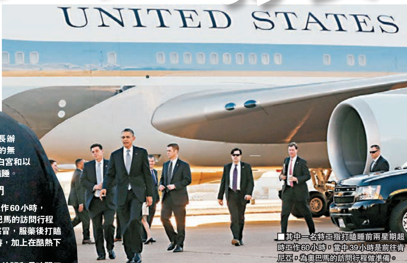
■其中一名特工指打瞌睡前兩星期超時工作60小時，當中39小時是前往肯尼亞，為奧巴馬的訪問行程做準備。