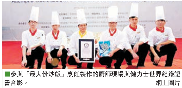
■參與「最大份炒飯」烹飪製作的廚師現場與健力士世界紀錄證書合影。