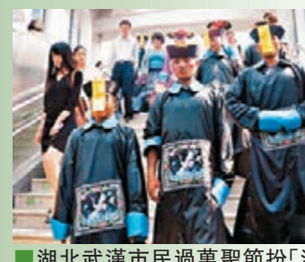
■湖北武漢市民過萬聖節扮「清朝殭屍」搭地鐵。

國家統計局上海調查總隊近日發佈調查報告顯示，雖然洋節在內地日漸風靡，但傳統節日仍更受居民重視，近五成受訪者對傳統節日有較深入的了解，更有近六成受訪者讀過四大名著，但青年重視傳統節日程度小於中老年受訪者。同時，調查顯示還有超過八成的受訪者可以識得一定數量的繁體字。