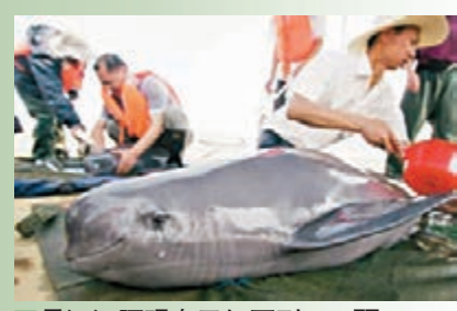
■長江江豚現存已經不到800頭。網上圖片

長期參與江豚保護的世界自然基金會長江項目高級總監雷剛說，目前長江江豚的種群數量正以每年13.7%的速度急劇下降，現存已經不到800頭。「如果不採取有效措施，未來5到10年內，長江江豚將在長江幹流中消失。」雷剛說。