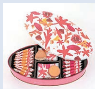
YOKU MOKU的限定版雜錦曲奇

為了迎接萬聖節,YOKU MOKU以主打皇牌產品「雪茄蛋卷」及朱古力夾心曲奇,以及鬼馬萬聖節包裝,配搭出不同的組合,讓顧客有多款選擇,增添萬聖節的節日氣氛。