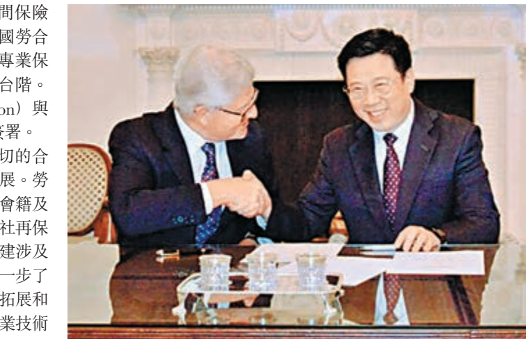
10月21日,中國太平保險集團董事長王濱(右)與勞合社主席約翰·納爾遜(左)在倫敦簽署合作諒解備忘錄。

勞合社主席約翰·納爾遜(John Nelson)表示,非常高興與中國太平保險集團董事長王濱一行到訪勞合社倫敦總部。雙方已達成共識,將致力於共同建立一個長期而穩健的業務合作關係。在過去300多年的歷史中,勞合社成為世界保險和再保險中心。未來勞合社將不斷尋求新的業務合作夥伴,使其資本來源更加國際化和多元化,從而進一步提升勞合社在全球市場的