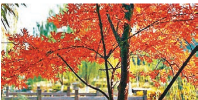
■韶關丹霞山擁有喀斯特地貌，紅葉最紅的時候，正在十月金秋。網上圖片

◆紅葉種類：楓樹、山烏柏、槭樹 ◆最佳時期：11月下旬至翌年春季節前 擁有喀斯特地貌的韶關丹霞山最紅的時候，正在十月金秋。當氣溫下降，楓葉變紅，成片的楓樹與丹崖赤壁相映成輝，耀眼的紅在深秋裡燃燒着，丹霞山紅到極致。 ★賞楓看點：深秋的丹霞山，遠觀能欣賞到秋日裡層林盡染的森林美景。深入丹霞山裡，則可以欣賞紅葉點綴着古木的別樣韻味。而登高遠眺，整個丹霞山的景色一覽無遺，紅葉閃爍，奇峰突起，可細數人面石、陽元石、姐妹峰、茶壺峰等。 ★其他玩法：在山下可領略在丹霞山錦石岩的天然岩洞奇景，在半山可參觀別傳寺，到山頂可欣賞僧帽峰、童子拜觀音、蠟燭峰等景觀，還可見長老峰和寶珠峰巍然聳立。如果時間充裕，丹霞日出更是不可錯過的美景，長老峰是遠眺奇峰幻景和旭日晚霞的好地方。此外，在滿目的紅葉紅石中敷一下天然溫泉，那種溫暖更是難忘。 ★美食：爆炒山坑螺、丹霞山豆腐、臭豆腐魚等。