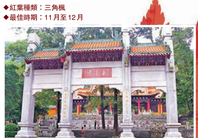
■江門新會圭峰山上的玉臺寺，傳說當年圭峰禪師宗密也曾在此坐禪。