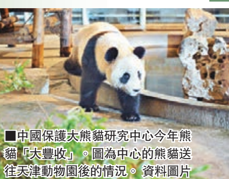
中國保護大熊貓研究中心今年熊貓「大豐收」。圖為中心的熊貓送往天津動物園後的情況。資料圖片

世界上最大的大熊貓人工繁育機構——四川的中國保護大熊貓研究中心昨日傳來好消息，該中心2015年共繁育大熊貓17胎26仔，成活23仔，改寫中心繁育記錄，而雙胞胎成活數量也創紀錄地達到9對。