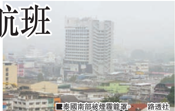
■泰國南部被煙霾籠罩。

受風向影響，來自印尼的煙霾近期開始影響泰南，當局指強風帶來煙霾後轉弱，令污染物停留當地。泰國運輸部門指，昨日有兩架由曼谷飛往旅遊勝地蘇梅島的航班需飛回原地，一架新加坡起飛的客機則轉飛布吉島。蘇梅機場官員昨晚透露，昨日上午10時後所有航班均因煙霾而取消。