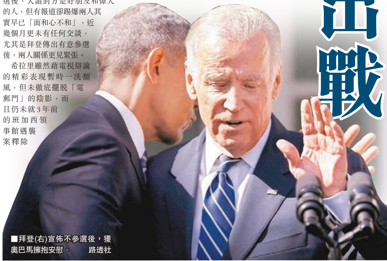
■拜登(右)宣佈不參選後，獲奧巴馬擁抱安慰。