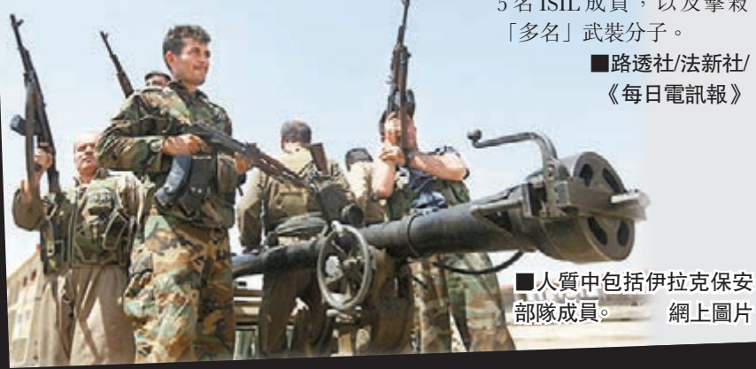
■人質中包括伊拉克保安部隊成員。