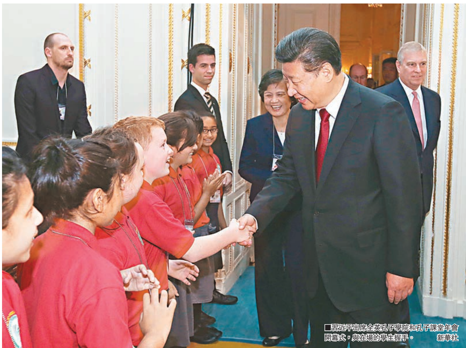
■習近平出席全英孔子學院和孔子課堂年會開幕式，與在場的學生握手。

「通過人文交流，中英兩國文化中的精華正在對兩國人民的思維方式和生活方式產生着奇妙的「化學反應」。」習近平如是說。