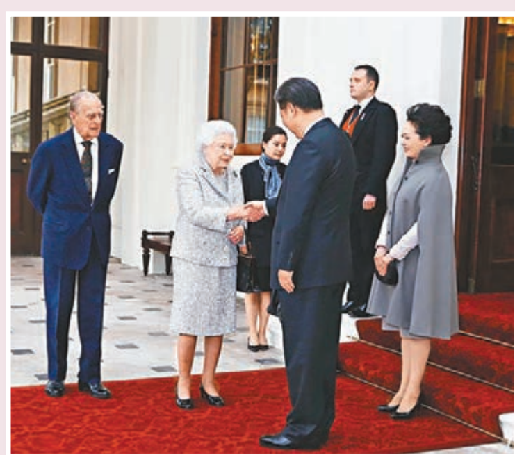
■習近平和彭麗媛同英女王伊利沙白二世夫婦握手話別。 新華社