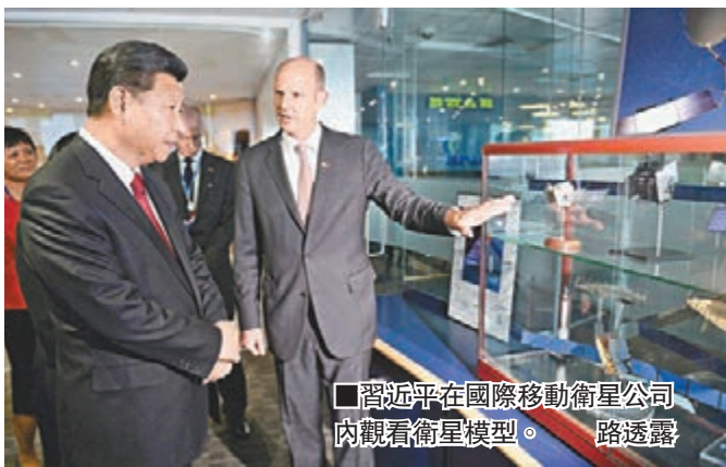
■習近平在國際移動衛星公司內觀看衛星模型。