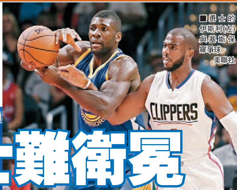
勇士的伊斯利(左)與基斯羅(右)爭球。