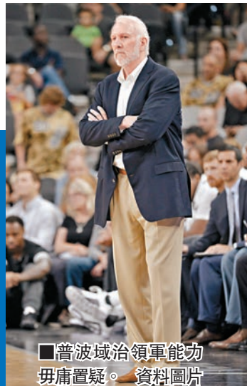
普波域治領軍能力毋庸置疑。資料圖片