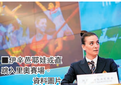
伊辛芭耶娃或直跳里奧賽場。資料圖片