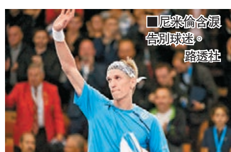
尼米倫告別球迷。

芬蘭史上最成功的男網球手尼米倫周二在斯德哥爾摩公開賽首圈比賽，以6:3、6:7和4:6的盤數不敵西班牙球手艾馬高，賽後宣佈正式結束長達15年的單打職業生涯。 ■記者 蔡明亮