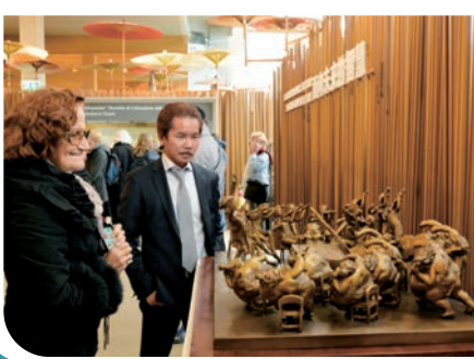
廣東著名的雕塑家許鴻飛和他的作品「胖女人」亮相在米蘭世博會廣東周上。

對於許鴻飛雕塑展，歐洲攝影家們表示，胖女人雕塑談諧生動、可愛可親，意大利以及歐洲民眾可以跨越語言限制，實現完美的藝術分享與心靈溝通。