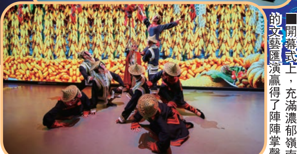
開幕式上，充滿濃郁嶺南風情的文藝匯演贏得了陣陣掌聲。