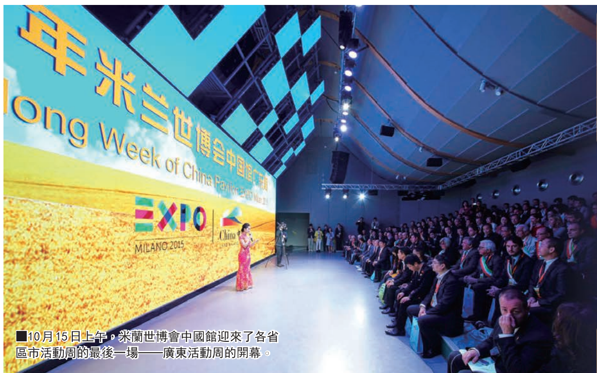
10月15日上午，米蘭世博會中國館迎來了各省區市活動周的最後一場——廣東活動周的開幕。

化、旅遊、科技、教育等領域富有成效的合作和交流，為中意關係的合作和發展做出更大的貢獻。據了解，廣東與意大利兩地企業家共300多人出席了廣東周開幕式。廣東省選與米蘭世博會組委會、中國館組委會以及意大利相關商協會合作舉辦「中國（廣東）——意大利經貿交流會」，積極宣傳推介廣東投資環境，為兩地企業搭建平台，創造投資貿易機會，促進兩地企業交流與合作。