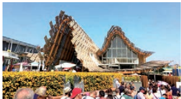
米蘭世博會中國館門外遊人如織。

參與米蘭世博會廣東周開幕式的中意嘉賓有一個普遍的共識，廣東是中國經濟發展的領頭羊，而米蘭和其所在的倫巴第大區是意大利經濟的發動機，兩者之間具有廣闊的合作交流前景。今年是中意建交45周年，可以說廣東來對了地方，也來對了時間。意大利是古絲綢之路的終點，也是新「一帶一路」的交匯點。米蘭世博會是一個走向意大利、走向歐洲、走向世界的良好平台。她希望通過米蘭世博會的平台，幫助廣東的農產品和優質美食進入國際市場，同時推動廣東和意大利乃至世界各國在經貿、文