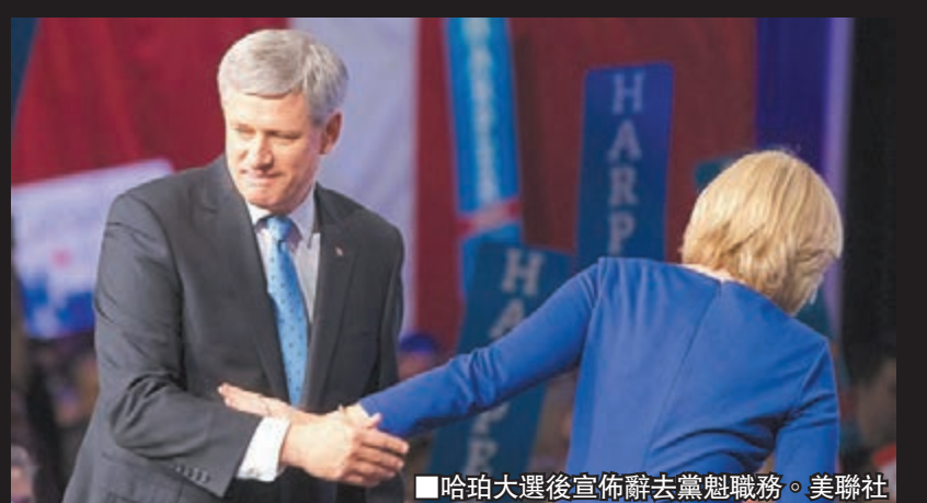
哈珀大選後宣佈辭去黨魁職務。美聯社