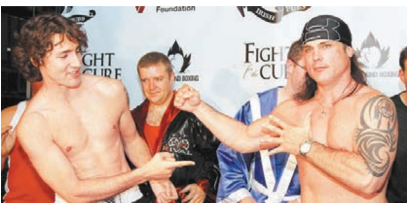
杜魯多(左)曾參加拳賽。