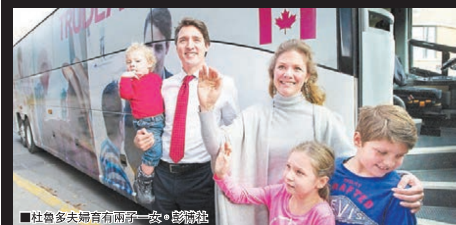
杜魯多夫婦育有兩子一女。彭德社