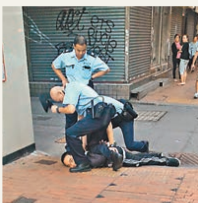
警員將涉斬途人的疑兇按倒地上制服。

現場為西邊街與德輔道西交界,即西區警署對開十字路口的安全島。消息稱,疑犯當時手持一把刀,首先在安全島刺傷一名男途人,然後向東行至德輔道西255號外再斬傷女途人,其他途人見狀大驚高聲呼救,驚動西區警署內的警員走出查看,多名警員見疑兇有刀在手,且語無倫次情緒激動,立即拔出佩槍喝令疑犯將刀放下,之後合力將疑犯按地制服,其間他激烈掙扎,一名警員被弄傷手指。警方稍後在疑犯身上再搜出另一把刀。疑犯其後被「五花大綁」送院檢查,再轉送青山醫院治療。