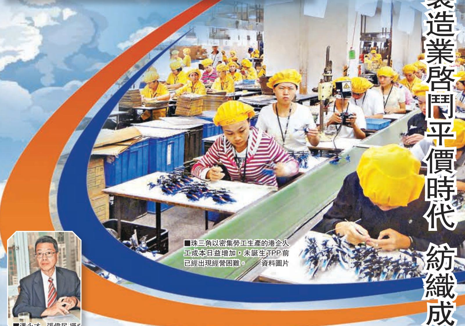
■珠三角以密集勞工生產的港企人工成本日益增加，未誕生前已經出現經營困難。 資料圖片

香港文匯報訊 (記者 涂若奔) 由美國主導的《泛太平洋戰略經濟夥伴關係協定》(簡稱 TPP)，近日取得實質性突破。由於中國不是 TPP 成員國，不少分析認為內地的貿易和經濟將因此大受衝擊，香港也難逃池魚之殃。貿發局、中銀香港等多個機構亦指出，部分在內地開廠的港商將會受到較大影響，尤其是鞋類和紡織成衣類，或會成為「重災區」，但香港本身已是全世界最自由經濟體，未來只要積極加入更多的區域貿易組織，並善用亞投行、「一帶一路」政策帶來的商機，反而可獲得更多的發展機遇。