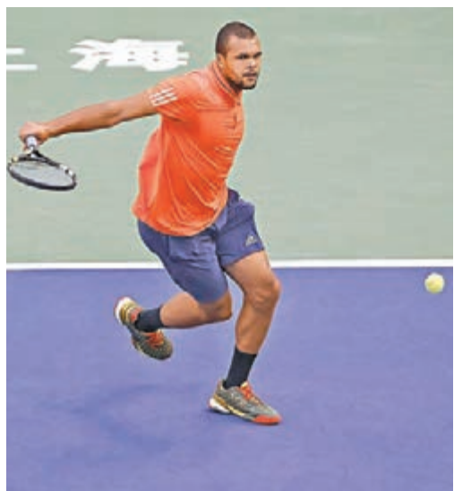
宋加力戰下落敗。

在下午結束的大師賽雙打決賽中,6號種子南非的卡拉森與巴西的梅羅羅組合,以直落2盤6:3擊敗5號種子伯萊里與霍連尼的意大利組合,加冕上海大師賽男雙冠軍。