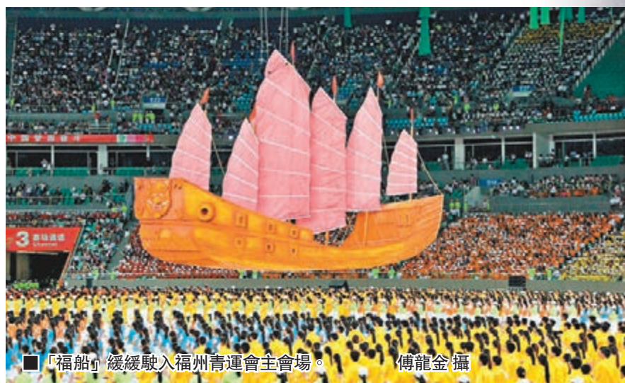
「福船」緩緩駛入福州青運會主會場。

點火儀式結束後從空中駛來一艘「福船」,青運會舞美總設計師苗培如表示,這是福州作為海上絲綢之路的起點,仿照鄭和下西洋所用的「鄭和寶船」設計,展示海絲文化。此外,當晚雖無大牌明星,但現場幾千名演員同時參與表演,全程包括序《神運福州》、第一篇《絲路追夢》、第二篇《海峽情緣》、第三篇《青春中國》4大部分,共14個精彩節目,令人矚目。