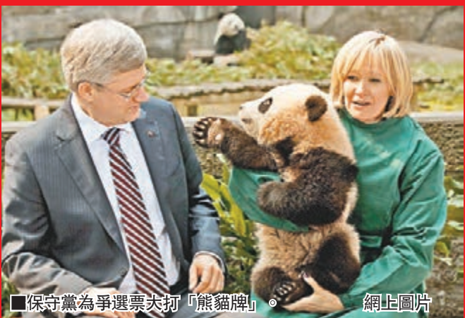
保守黨為爭選票大打「熊貓牌」。