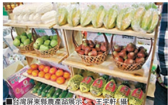
台灣屏東縣農產品展示。