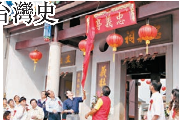
馬英九為屏東竹田六堆忠義亭正名揭牌。

馬英九闡述忠義亭的源起，繼而提到甲午戰爭及乙未戰爭的歷史。他說，台灣人在乙未戰爭犧牲約10萬人，佔台灣當時總人口4%，「有人說台灣人沒有抗日，這是不懂台灣歷史」，他每次只要讀到這段歷史，就感慨萬千。