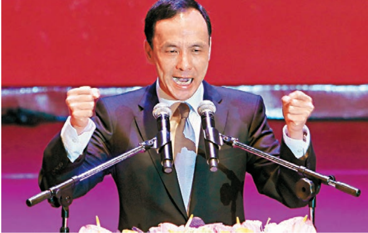
最新民調顯示，在國民黨「換柱」後，朱立倫的支持度上升至21.9%。

朱立倫說，蔡英文擔任「國安會」諮詢委員時，曾經提出「兩國論」，為綠營兩岸政策的論述基礎；而民進黨還有「台獨黨綱」，蔡英文的「維持現狀」是不是包括這兩點，蔡英文在說兩岸要「維持現狀」