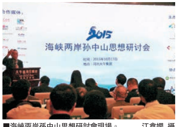
海峽兩岸孫中山思想研討會現場。

是次研討會由中國台灣網聯合中山大學孫中山研究所、台灣中華文化推廣協會、中華傑出青年經貿發展促進會、河北大午集團、中華孫氏文化園共同舉辦。