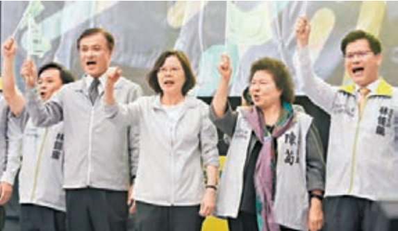
蔡英文昨日出席全黨競選總部成立大會，和陳菊(右二)等人一起高喊當選。

香港文匯報訊 據台灣媒體報道，民進黨「總統」參選人蔡英文競選總部昨日成立，蔡英文競選總部主任陳菊說，最後一里路最困難，要比過去更認真打拚。