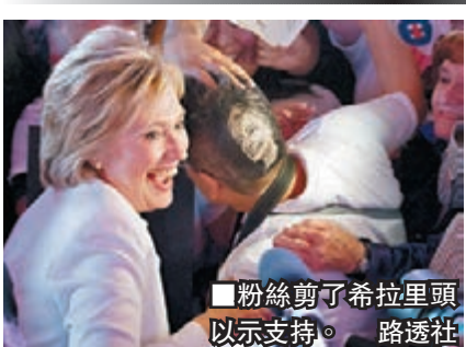
粉絲剪了希拉里頭以示支持。

美國總統初選參選人前日公佈選舉開支，顯示兩黨參選人整體燒錢速度較以往快25%。民主黨參選人希拉里吸金最多，達7,500萬美元(約5.8億港元)，但已燒掉4,450萬美元(約3.4億港元)，佔籌得經費的59%。