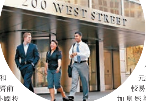
其國債以美元結算，較易受美國加息影響。加上巴基斯坦及孟加拉債券流動性較低，未及印度債券吸引。

印度10年期國債息率接近7.5厘，較中國及馬來西亞4厘或以下為高。量度亞洲區本幣債券表現的匯豐銀行亞洲本地債券指數亦顯示，以印度盧比結算的印度債券，回報率以美元計達4.8%，是除日本外表現最好的債券。其餘國家如俄羅斯、巴西、巴基斯坦及孟加拉債券雖回報率更高，但