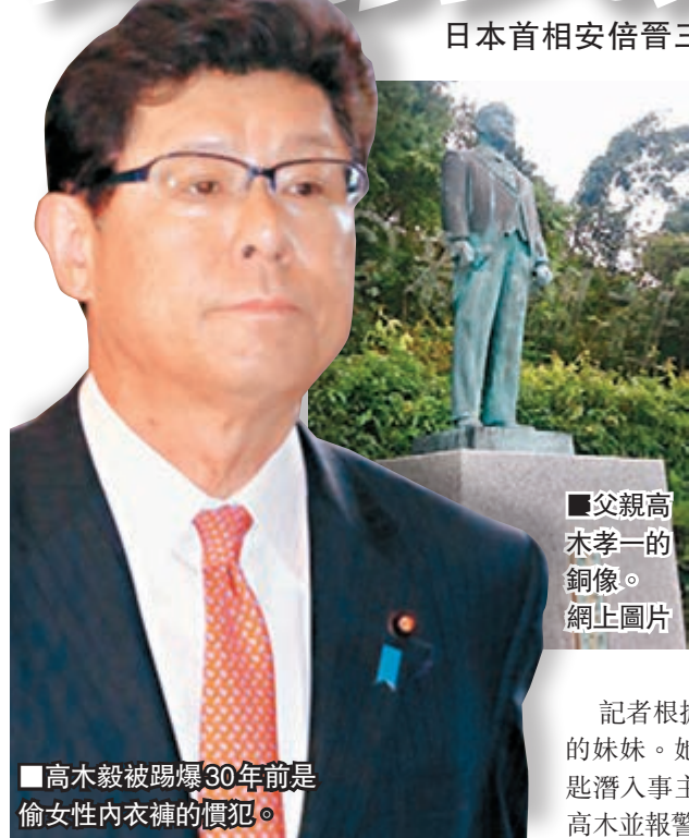
高木毅被踢爆30年前是偷女性內衣褲的慣犯。