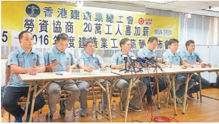
2015/16 建造業工人薪酬(摘錄)

香港建造業總工會昨日宣佈，下月1日起，16個不同工種的建造業工人均獲加薪，平均增幅為10.3%。