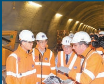
梁振英(左一)視察鐵路隧道的建造工程。