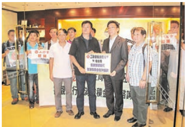
工聯會權益委員會到積金局遞交請願信，要求積金局報告持平反映勞方意見。

高永文指出，兩地共同面對因人口老化、新出現與再度肆虐疾病的威脅，以及非傳染病所帶來日漸沉重的負擔，而需面對隨之而來在醫療服務提供方面的挑戰。《諒解備忘錄》將為兩地提供框架，使雙方進一步分享專門知識及加強合作，有利香港醫療系統發展，以應付各種社會變化和公眾需要。