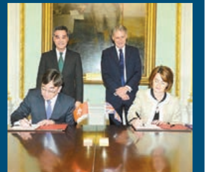
高永文(前排左)與英國公共衛生部長(前排右)簽署備忘錄。