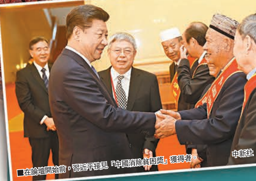
■在論壇開始前，習近平接見「中國消除貧困獎」獲得者。中新社