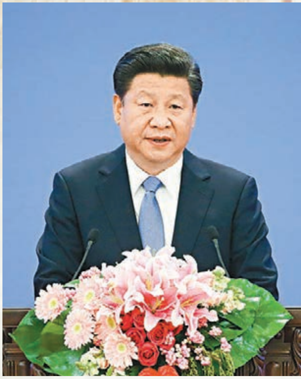
■習近平出席2015減貧與發展高層論壇並發表主旨演講。

香港文匯報訊（記者 海巖 北京報道）今年10月17日是中國第二個扶貧日，也是第23個國際消除貧困日。10月16日，2015減貧與發展高層論壇在北京人民大會堂金色大廳舉行，中國國家主席習近平在主旨演講中就加快全球減貧進程提出四大倡議，呼籲全球共同努力在未來15年內徹底消除極端貧困。此外，習近平還表示，未來5年，中國建設全面小康社會「不能有人掉隊」。