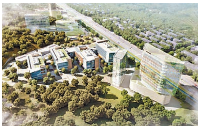
寧波生物產業創新中心鳥瞰圖

2013年1月, 中科院上海藥物所寧波生物產業創新中心項目在寧海縣正式簽約, 由寧波市人民政府與中科院上海藥物所共同創建, 項目初始投資為5億元人民幣。去年10月, 寧海縣人民政府正式向上級部門爭取並獲原則同意在寧波生物產業園基礎上建立寧波「千人計劃」產業園生命健康(寧海)園區。今年6月, 寧波生物產業園通過寧波國家高新區「一區多園」第二批分園創建單位認證, 正式由掛牌分園變更為創建分園。