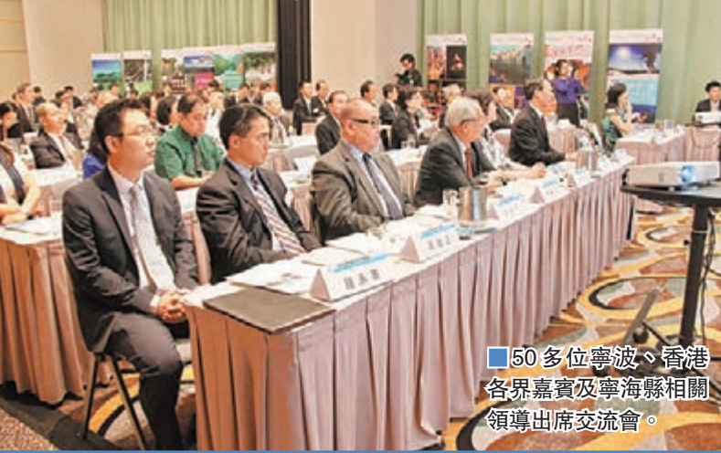
50多位寧波、香港各界嘉賓及寧海縣相關領導出席交流會。

近年來, 隨着人們對健康的關注不斷提升, 生命健康產業也愈來愈得到社會各界的關注。浙江省寧波市寧海縣近年積極佈局生物醫藥、醫療器械、高端診療及養生休閒等產業, 已經成為寧波乃至長三角地區最具潛力的健康產業發展基地。前日, 藉2015甬港經濟合作論壇在港召開之機, 寧波生物產業園和寧海縣人民政府在香港舉辦生物醫藥產業合作交流會, 邀請甬港兩地專家學者、商界人士, 探討如何提升香港乃至全球相關資源對寧海生物醫藥產業的關注度, 實現在更高層次、更多方面的交流與合作。