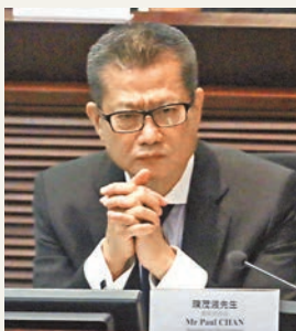
發展局局長陳茂波表示,未來大嶼山一系列發展將令區內職位增至約47萬個。 資料圖片

香港文匯報訊(記者 梁悅琴)發展局局長陳茂波昨日回答立法會議員提問時表示,「東大嶼都會」計劃現只屬初步構思階段,由於涉及大規模填海及龐大基礎建設及投資,須謹慎考慮。由於在上個立法會會期未能取得撥款,相關策略性研究未能展開,政府將再向立法會申請撥款開展有關研究,以探討興建人工島的可行性及發展的規模。