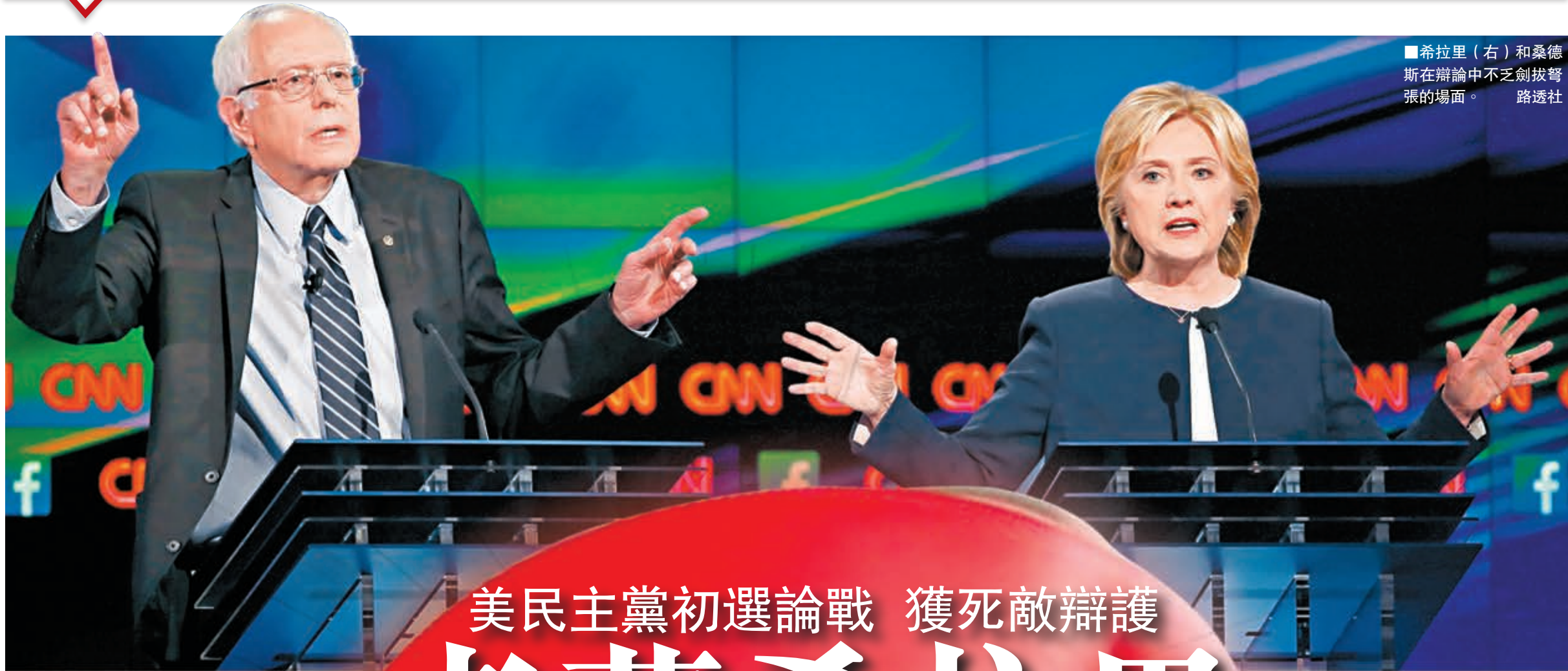
■希拉里(右)和桑德斯在辯論中不乏劍拔弩張的場面。