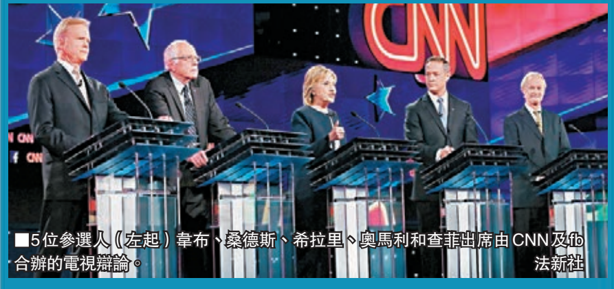
■5位參選人(左起)韋布、桑德斯、希拉里、奧馬利和查菲出席由CNN及法新社合辦的電視辯論。