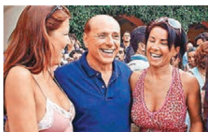
■貝盧斯科尼身邊不乏女伴。網上圖片

現年79歲的意大利前總理貝盧斯科尼授權傳記《我的道路》(暫譯)近日出版，書中不僅披露他與美國前總統布希和英國前首相相理雅的關係，更首次大爆他的風流韻事，包括聲名狼藉的bunga bunga派對，舉行派對的大宅，以及與無數名模女星的交往經過等。貝盧斯科尼身邊不乏女伴。網上圖片。貝老的bunga bunga派對曾被傳媒形容為酒池肉林的淫亂派對，不過貝老在書中宣稱所謂派對只是優雅高尚的沙龍活動，人人都有好好穿上衣服。他承認曾經邀請藝名「魯比」的舞孃馬魯參加派對，但否認曾與對方發生性行為。傳記亦提及高官名人的軼事，例如他曾與布希晉餐，力勸對方不要入侵伊拉克。貝老當時以森林故事比喻，布希是森林之王獅子，伊拉克前總統薩達姆則是狼，指雖然狼吃掉了三隻小豬和紅帽的祖母，但獅子還是沒證據把他治罪，據稱當時在場的美國官員都尷尬地笑了，唯獨布希面不改容，表示一定要打倒薩達姆。