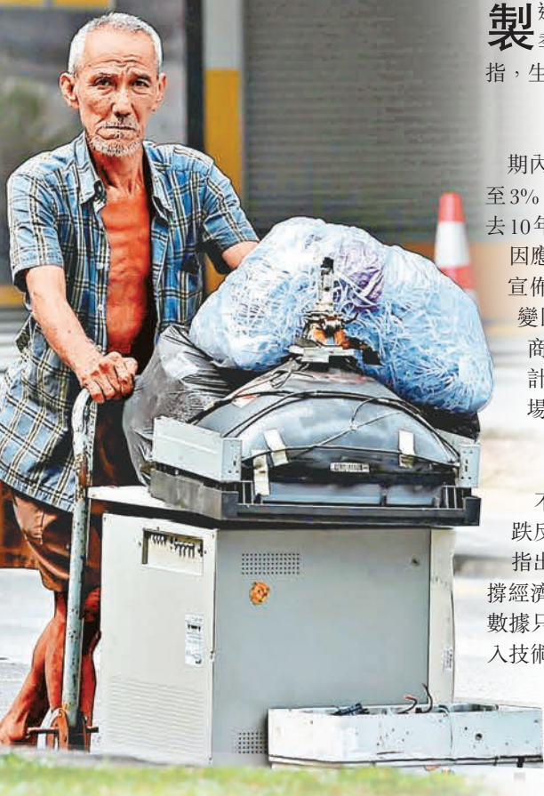
■新加坡今年增長料介乎2%至2.5%，低於過去10年的平均增長率。

中國經濟增長放緩令東南亞多國備受壓力，新加坡昨日公佈數據顯示，當地第三季國內生產總值(GDP)初值為增長0.1%，好過市場預測的收縮0.1%，僅僅避過技術性衰退，第二季GDP收縮幅度亦從此前的4%調整為2.5%；但若換算成年率計，新加坡截至9月的12個月內經濟增長僅1.4%，按季跌0.6%，是3年來最差。為提振經濟，新加坡金融管理局(MAS)昨宣佈今年內第二次放寬貨幣政策，繼1月後再次下調坡元兌一攬子貨幣的升值速度。