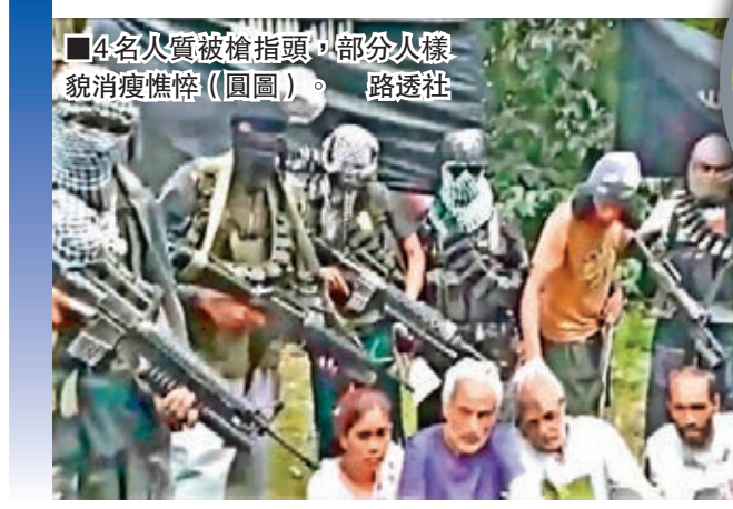
■4名人質被槍指頭，部分人樣貌消瘦憔悴(圓圈)。

上月在菲律賓南部度假村被綁架的4名人質終於傳出音訊，網上軍事行動。前晚出現一段影片，片中他們要求菲律賓政府停止轟炸阿布沙耶夫游擊隊的根據地，又呼籲加拿大政府與綁匪談判。菲國軍方正查證片段真偽，指不清楚肉參藏匿地點及綁匪身份，又指不會與綁匪談判，亦不會停止