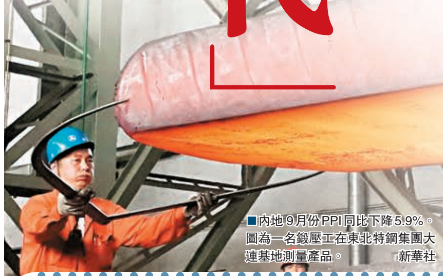
■內地9月份PPI同比下降5.9%。圖為一名鍛壓工在東北特鋼集團大連基地測量產品。

受國際大宗商品價格回調、國內工業生產增速放緩以及基數因素共同影響,近期PPI月度同比跌幅不斷加深,6月、7月、8月降幅分別為-4.8%、-5.4%和-5.9%,創近6年最低點,9月PPI繼續維持在低位。PPI長時間同环比回落的情況,過去僅僅在2008年至2009年、1997至1998年等經濟疲軟的時期出現過。專家預計,目前工業生產領域持續面臨通縮壓力,其中既有傳統領域產能過剩的因素,也很大程度受國際大宗商品價格大幅下跌的影響。當前國際大宗商品價格繼續低位震盪,反彈動力不足。考慮到四季度穩增長政策加力增效,有助於工業產品價格企穩,預計未來PPI同比跌幅有望收窄,但難以擺脫低迷態勢。