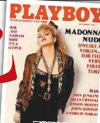
常用麥當娜做封面