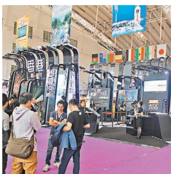
第二屆中國-俄羅斯博覽會暨第二十六屆哈洽會上的香港展區。