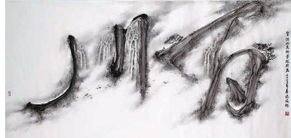
新隸強的繪畫作品《百川》。 網上圖片