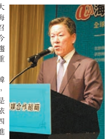
■韓國國會議員朱昇鎔出席了開幕大會並發表致辭。

朱昇鎔表示，全球華文媒體齊聚韓國，這將促進華文媒體的相互交流，並有利於東北亞經濟的繁榮。韓國是一個沒有資源的小國，對出口十分依賴。中國的交易量佔據韓國國口的四分之一。同時，在朝鮮半島的統一進程中，中國也佔據十分重要的地位。因此，中韓之間的經貿戰略關係對於雙方都十分重要。朱昇鎔表示，亞洲是數量最有活力的地方。據相關調查機構資料顯示，到2030年，亞洲人口數量將佔到全世界的60%，GDP份額將佔到全球的40%。在人口和經濟都將飛速發展的趨勢下，華文媒體的角色和責任將愈加重要。