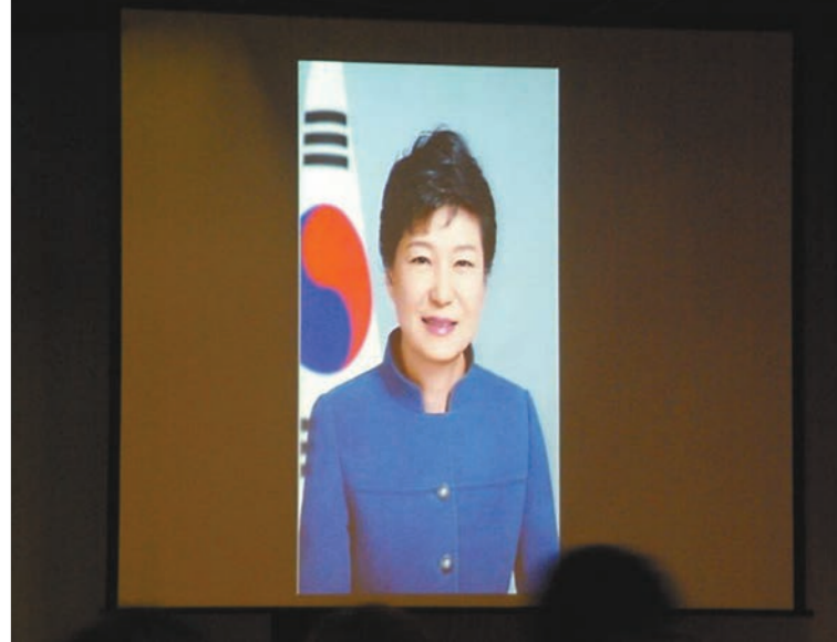
■韓國總統朴槿惠發來賀信。

海外華文傳媒合作組織2015年年會13日在韓國首爾召開，韓國總統朴槿惠特發來賀信。朴槿惠表示，近年來中韓兩國文化交流日趨緊密，希望與會的海外華文媒體可以同心同德，為韓國與中國、以及全亞洲的發展積聚力量。