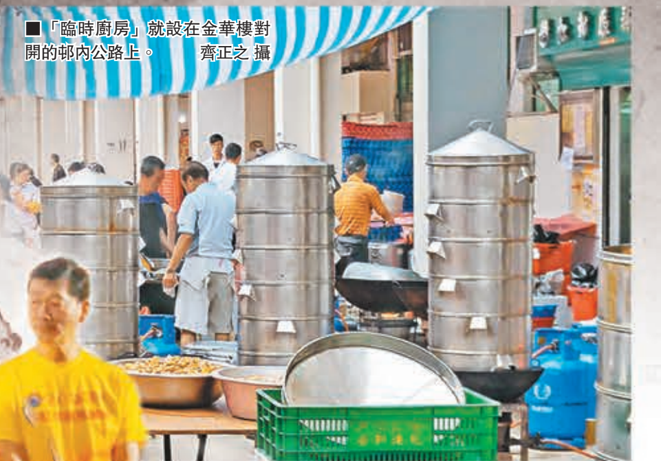
■「臨時廚房」就設在金華樓對開的邨內公路上。