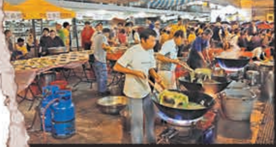
■由於宴席逾百圍，在邨內空地「臨時廚房」的廚師也忙個不停。