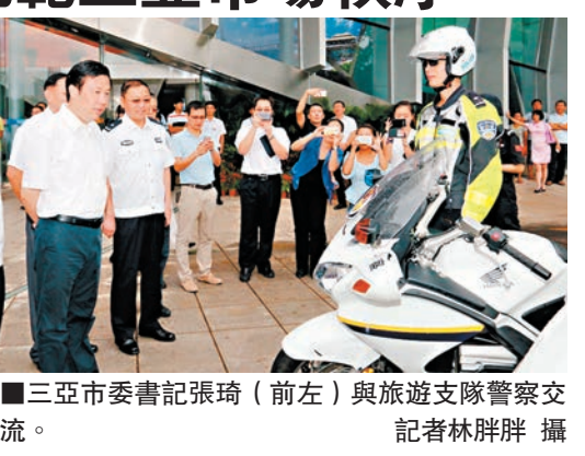
■三亞市委書記張琦(左前)與旅遊警察支隊警察交流。

據了解,為了進一步加強三亞旅遊市場管理,規範旅遊市場秩序,為國內外遊客打造良好的旅遊環境,三亞市在去年底提出了設立專職維護旅遊市場秩序和旅遊治安環境的旅遊警察隊伍的設想。今年8月,海南省公安廳正式批覆同意三亞市公安局設立旅遊警察支隊,將對促進全市旅遊業的健康蓬勃發展起到重要作用。 作為內地首支專職旅遊警察隊伍,三亞市公安局旅遊警察支隊將建立健全快速高效的「多部門聯動聯動、聯合執法」的工作機制,實現「行政執法和刑事執法的無縫銜接」,全面加強三亞旅遊市場監管,嚴厲打擊破壞旅遊市場秩序的違法犯罪行為,為廣大市民和遊客提供更加優質高效的服務。 據悉,自三亞旅遊警察支隊籌備組成立以來,共查處涉旅案件30起,扣押非法載客摩托艇1艘,抓獲違法人員32人,行政拘留30人,對5人處罰款各1,000元,有效地打擊和遏制了旅遊市場的違法犯罪活動。