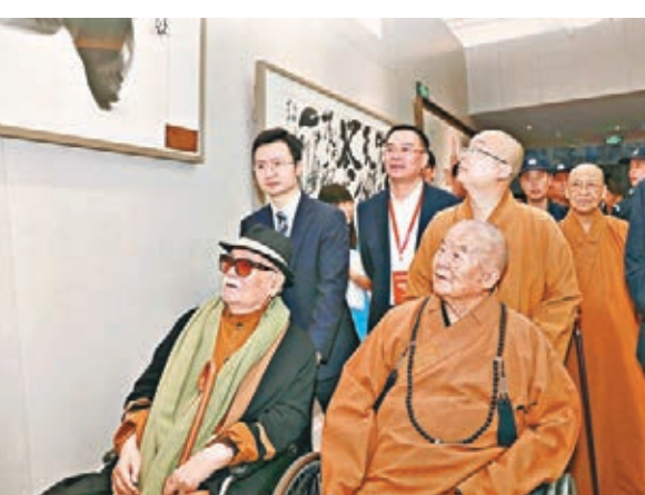
星雲大師(輪椅者右)和李奇茂(輪椅者左)一起參觀展覽。

著名水墨畫大師、台灣藝術大學李奇茂先生與星雲大師相識相交60載，結下了深厚的友誼。李奇茂稱星雲大師「是終身學習的導師」，星雲樓的啟用也是繼續學習中華傳統文化新的開始。現場，李奇茂和星雲大師弟子將逾300幅書畫作品捐贈給南京大學，並免費對外開放，用於弘揚和傳承中華傳統文化。星雲大師《一筆字》書法展也在星雲樓一樓開展。