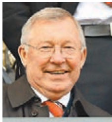
費格遜不贊同球會輕率易帥的做法。