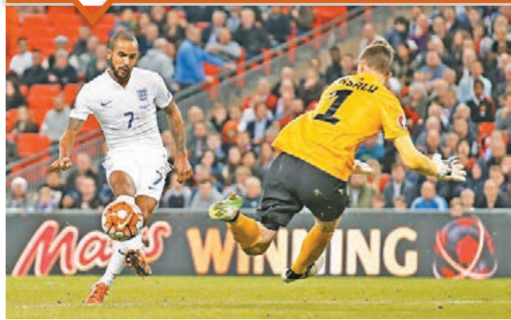
禾確特(左)近況「弗到漏油」。