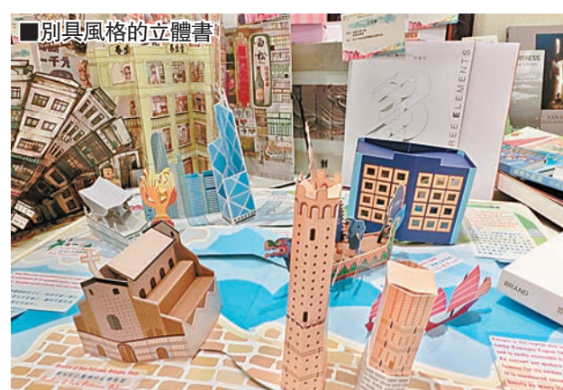
■別具風格的立體書

書籍，當中包括五家香港印刷企業特別為「香港館」度身訂造，展現香港特色面貌的立體書籍，藉此彰顯香港印刷的精巧技術及跳出框框的創意設計，有助香港印刷商向海外業界及讀者展示實力，締造商機。參與傳媒午餐聚會的立法會議員馬逢國表示，自己深刻體會到香港的文化創意產業已經取得了很大的成就，設立「香港館」，有組織、具規模，令業界能夠以團隊方式整體出席國際文化活動，大力幫到了業界，也