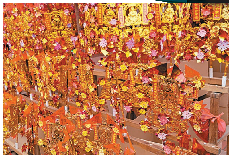
■沙田的傳統習俗和文化源遠流長。