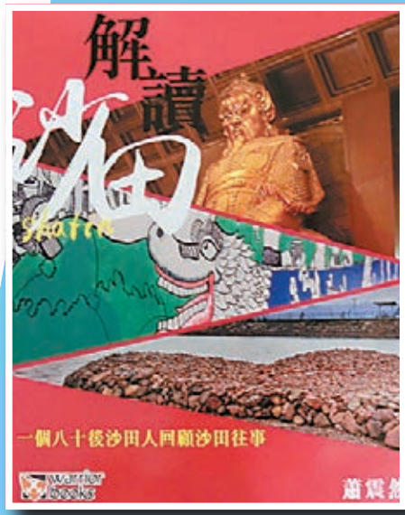
■《解讀沙田：一個八十後沙田人回顧沙田往事》