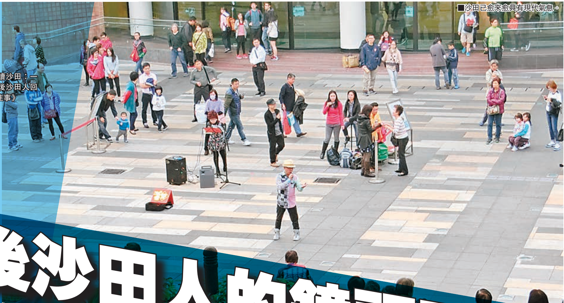
■沙田已愈來愈具有現代氣息。