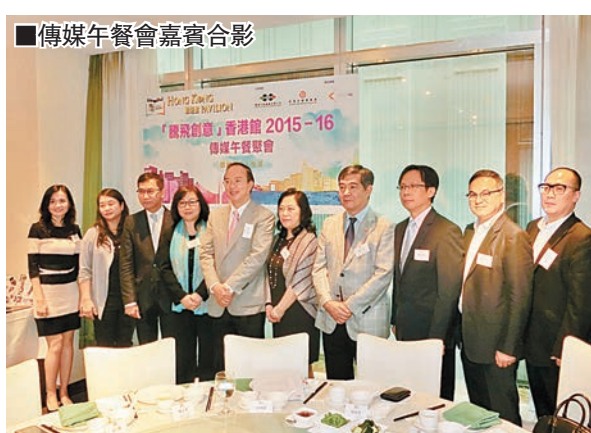
■傳媒午餐聚會嘉賓合影

據悉，「法蘭克福書展香港館」內的企業產品展示區就為17家香港出版社及印刷商提供獨立攤位，重點展示他們近400項的展品，讓香港業界可以直接接觸外地買家，為香港增值創匯。協助本港中小型出版及印刷商發展一直是「騰飛創意」項目的目標，他們不少產品在本地及國際比賽屢獲殊榮，今屆「香港館」將繼續重點展出這些獲獎的優秀作品。此外，上屆備受矚目的「立體書籍展示區」亦會載譽歸來，並展出超過30本由香港印刷商承印的精美立體