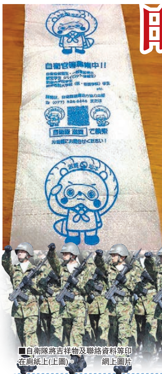
自衛隊將吉祥物及聯絡資料等印在廁紙上(上圖)。網上圖片

自衛隊滋賀地方協力本部承認發配廁紙給學校，發言人表示，選擇廁紙是想用國民認為有用的東西作宣傳，強調宣傳廁紙在本部其他活動上均有使用，目標不限於學生。本部已經回收宣傳廁紙。■日本《朝日新聞》/《日本時報》/《國際財經時報》