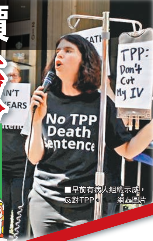
早前有病人組織示威，反對TPP。