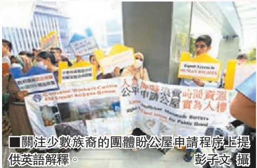
關注少數族裔的團體助公屋申請程序上提供英語解釋。