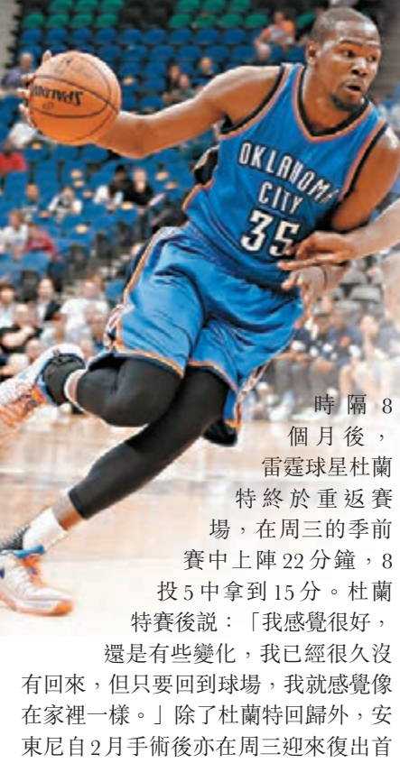
杜蘭特積極找回比賽節奏。