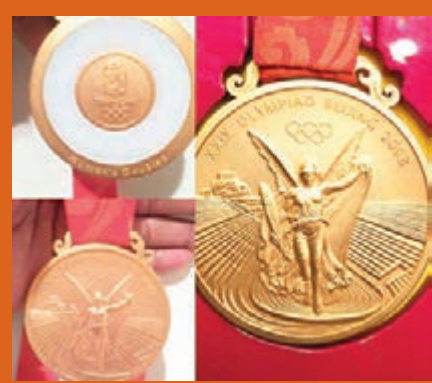
細威在社交網站表示尋回京奧雙打金牌。

另外，自從美網女單準決賽輸球出局後，細威就消失在網球賽場上，不過並沒有消失在人們的視野中。據美國傳媒報道，