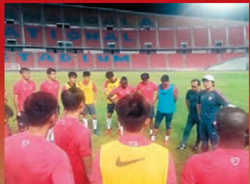
港足昨晚到比賽球場備戰。

另外，港足作客對不丹的比賽已確定會通過YouTube直播，屆時香港球迷可以透過網上直播欣賞賽事。