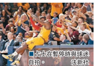
占士在暫停時與球迷自拍。

騎士周三在季前賽首度出擊，最終以96:98不敵鷹隊，「大帝」勒邦占士上陣22分鐘，13投僅3中，拿下8