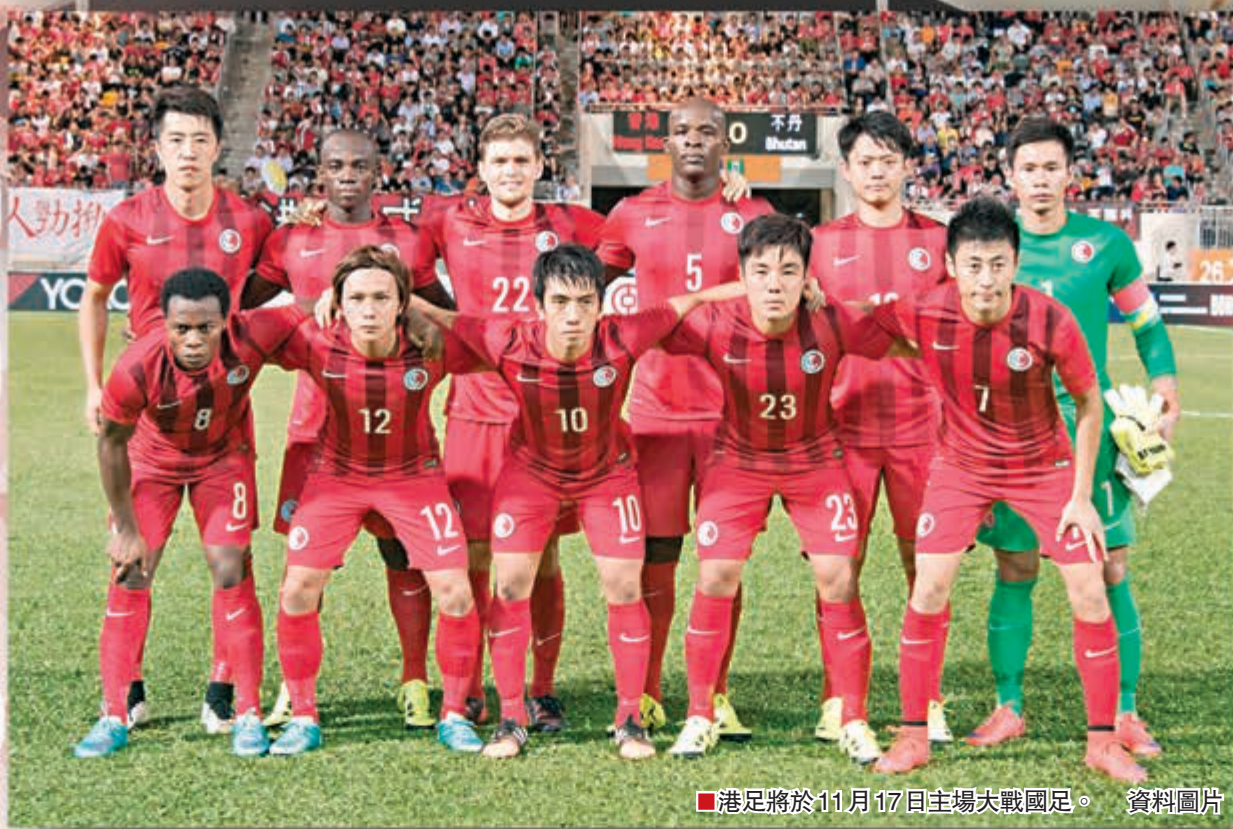
港足將於11月17日主場大戰國足。 資料圖片

香港文匯報訊(記者潘志南)經過與康文署開會磋商後，足總考慮到香港大球場的草地狀況，以及港足意願和觀賽氣氛等因素，昨日正式敲定港足下月中主場對國足的世界盃亞洲區外圍賽次圍賽在旺角場上演。