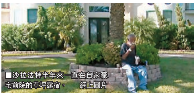
沙拉法特半年來一直在自家豪宅前院的草坪露宿。