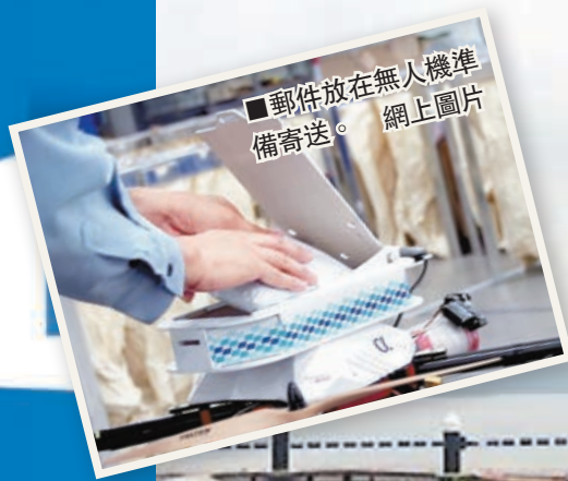
郵件放在無人機準備寄遞。