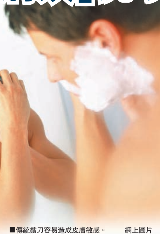
傳統鬚刀容易造成皮膚敏感。網上圖片

人類鬚鬚分子內含有「發色團」，決定鬚鬚的不同顏色。曾於1989年發明強脈衝光的古斯塔夫松，與光學工程師合作研究，在不同顏色鬚鬚中找出共同含有的發色團，只要用特定波長的激光，就能直接破壞發色團和鬚鬚。鬚刀切面安裝一條可發出激光的光纖，這種波長的激光不會傷及眼睛或刺激皮膚。激光能破壞鬚鬚分子，變相可使鬚鬚生長速度減慢。