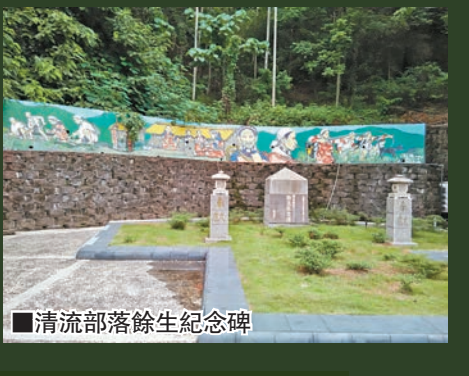
清流部落餘生紀念碑

在泰雅度假村周邊的仁愛鄉互助村的「清流部落」及國姓鄉咖啡莊園都值得一遊。魏德聖開拍的《賽德克·巴萊》講，是1930年賽德克族反抗日本暴政的悲壯故事，屬泰雅族亞族賽德克族群原居霧社地區，因不堪日本暴政統治，爆發霧社原住民抗日事件即「霧社事件」，震驚國際。而「清流部落」的居民就是日本對原住民屠殺「霧社事件」的餘生後裔。日治時期日本人稱「清流部落」為「川中島社」，後來因政府見北港溪清澈才命名為清流部落，現今的清流部落以發展文化帶動經濟，到此可體驗當地美食、編織DIY還能深度了解清流部落的人文歷史、享受部落風情。此地設有餘生紀念碑、餘生紀念館，裡面有圖片及文字詳細介紹霧社事件始末，睇完心中卻有股哀愁。