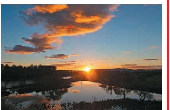
夕陽下的烏蘇里江濕地。