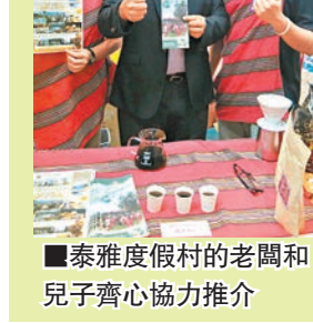
泰雅度假村的老闆和兒子齊心協力推介

臨下欣賞亮麗雄偉的美景嗎？度假村在山上特別建造了一條空中步道，你既可以爬山上去，又可以坐登山列車上，到達空中步道就可以鳥瞰川中島尋找賽德克，在空中軌道接受森林芬多精的洗禮，享受優遊於萬物之上的快感。在山上有一條總長一百多公尺的霧社事件時光隧道、賽德克故事館，有助你了解賽德克和泰雅族的根源、風俗民情、傳說故事。