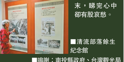
清流部落餘生紀念館