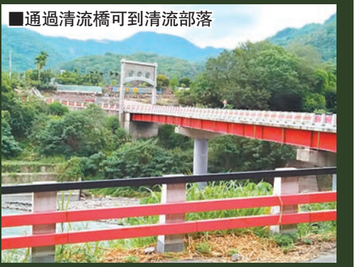
通過清流橋可到清流部落