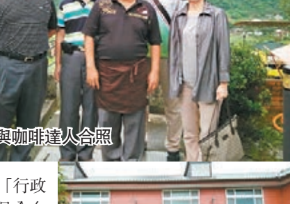
業者與咖啡達人合照

能呈現出「國姓咖啡」的香味，因為中烘焙會讓咖啡豆帶點特殊的果酸香，風味也較獨特。為提升品質，「國姓農會」舉辦南投縣咖啡評鑑活動，也將冠軍產品送往美國參加CQI咖啡評鑑，與國際各地知名咖啡進行PK，提升知名度。