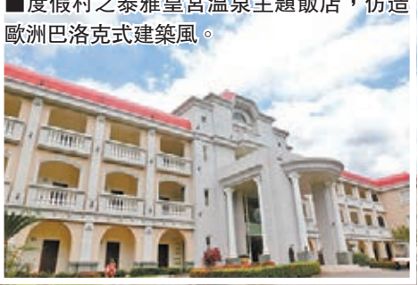
度假村之泰雅皇宮溫泉主題飯店，仿造歐洲巴洛克式建築風。

泰雅度假村位於南投縣埔里鎮北側，仁愛鄉及國姓鄉交界處，南側緊臨北港溪，其支流眉原溪則流經東側。