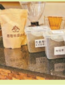
台南泰雅民旅村特色美食