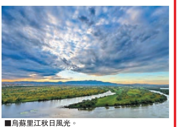
烏蘇里江秋日風光。