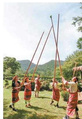
泰雅度假村打麻糬，與原住民歌舞互動。

泰雅度假村位於南投縣埔里鎮北側，仁愛鄉及國姓鄉交界處，南側緊臨北港溪，其支流眉原溪則流經東側。