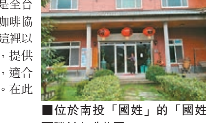
位於南投「國姓」的「國姓百勝村咖啡莊園」

去了「國姓百勝村咖啡莊園」參觀，其擁有「行政院」農委會審核通過的休閒農場認證標章；也是全台灣規劃較為完善的咖啡莊園，更獲得美國精品咖啡協會SCAA認證，拿下104年亞洲第二高的分數。這裡以咖啡、民宿、露營和泡湯等四大主題休閒服務，提供生態導覽、咖啡館、DIY活動、特產販售區等，適合情侶、夫妻、大小家庭和親友聚會、團體開會。在此品嚐咖啡，吃下午茶樂趣無窮。