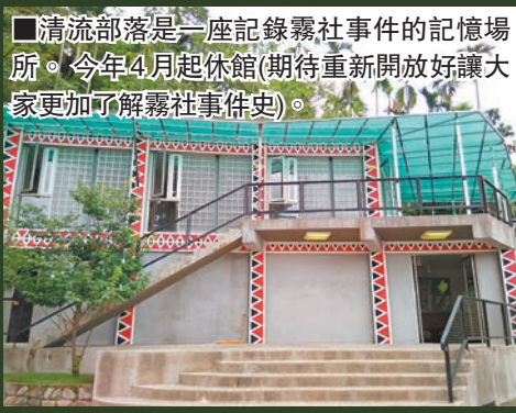
清流部落是一座記錄霧社事件的記憶場所。今年4月起休館(期待重新開放好讓大大家更加了解霧社事件史)。