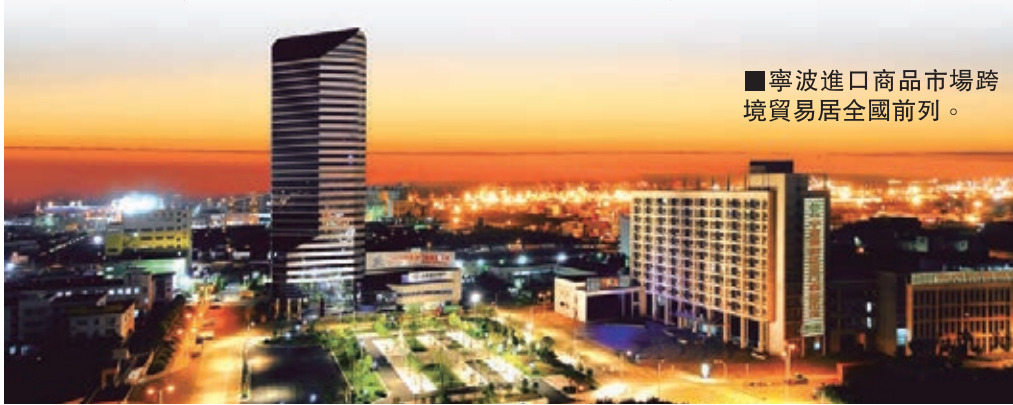
寧波進口商品市場跨境貿易居全國前列。

香港文匯報訊(記者周方怡寧波報導)2015甬港跨境電商合作論壇13日下午將在香港會議中心舉行，寧波市政府口岸與打擊走私辦公室主任海濱表示，通過論壇，與會方可探討交流甬港兩地在跨境業務領域的長遠發展，促進甬港跨境貿易電子商務及其物流領域的深入合作、促進寧波跨境電商企業與香港大型貿易商的互動，進一步拓寬寧波跨境進口電商貨源渠道，擴大售賣商品品類。