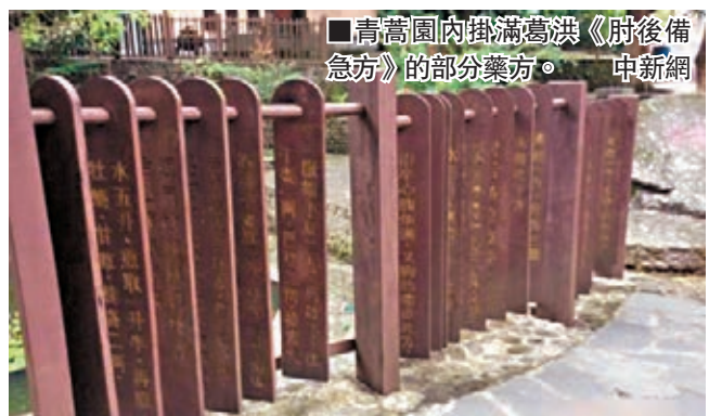
青蒿園內掛滿葛洪《肘後備急方》的部分藥方。

據悉，屠呦呦在一次偶然機會看到葛洪所著的《肘後備急方》中所言，「青蒿一握，以水二升漬，絞取汁，盡服之。」「絞取汁」不是傳統的水煎煮中藥之法，而是消除了沒有抗瘧活性且有副作用的酸性部分，保留了抗瘧活性強、安全可靠的中性部分。因此葛洪所著之書確實