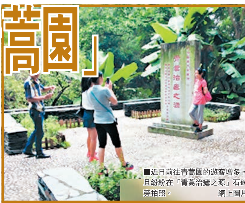
近日前往青蒿園的遊客增多，且紛紛在「青蒿治瘧之源」石碑旁拍照。

羅浮山位於東江之濱，在北回歸線上，屬亞熱帶季風氣候，雨量充足，植物茂密，其中有逾3,000種植物生長於此，而