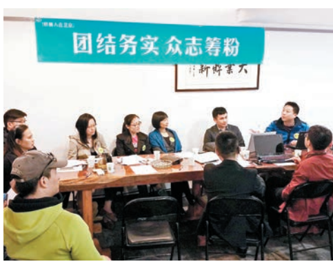
「眾籌創業」已成內地創業新形式，圖為一家由31名廣西老鄉眾籌投資、共同經營的桂林米粉店股東在商討商業策略。

眾籌是一種新生事物，通常指發起人通過網絡網路信息平台發佈籌款項目，並向支持者募集資金。相對於傳統融資方式，眾籌更為開放。一些專家和業內人士認為，眾籌模式聽起來前景很好，但風險同樣不容忽視。相關律師表示，當下涉及眾籌方面的法律法規仍是空白，內地證券業協會僅在2014年發佈了一個《私募股權眾籌融資管理辦法(試行)》徵求意見稿，且不屬於法律法規範疇。「正是因為無法可循，眾籌風險不可控性明顯較強，容易出現資金混亂、捲款潛逃等問題。」