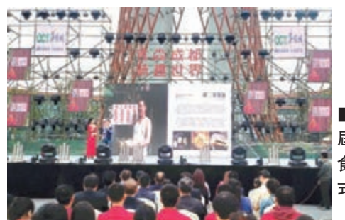
第十二屆成都美食節開幕式現場。

在當天的開幕式現場,日本新瀉市地域魅力創造部松田暢夫部長接受本報記者採訪時表示,成都在美食方面發展很發達,而且也是聯合國美食之都,新瀉市也加入聯合國教科文組織的創意城市聯盟,所以來成都學