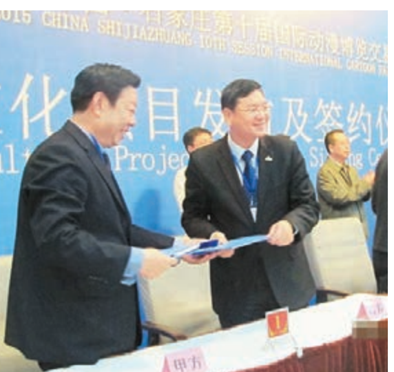
2015中國·石家莊第十屆國際動漫博覽交易會近日落幕。

了11家,湧現出深度動畫、精英影視、燕娃動漫等優秀動漫企業,推出了《趙州橋》、《葉羅麗》、《老子道德三百問》等一批動漫作品在央視播出。此外,成立了全國動漫衍生品生產銷售戰略聯盟,建成了中國·石家莊動漫衍生品集散交易中心、國家動漫產業發展基地創業孵化園、石家莊動漫大廈、東方文化創意產業基地等重點動漫項目,帶動了人才、技術、作品、資金和相關產業資源的集羣整合。